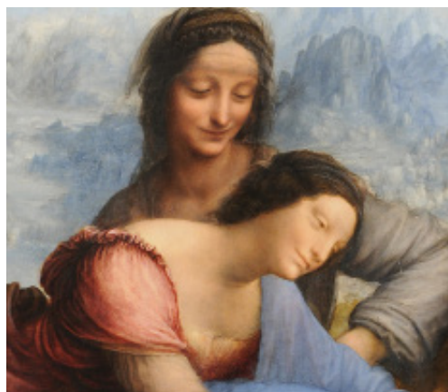
La Sainte Anne, Musée du Louvre, Paris — France