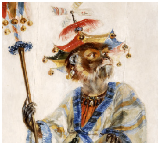
LA GRANDE SINGERIE, Château de Chantilly, Chantilly — France