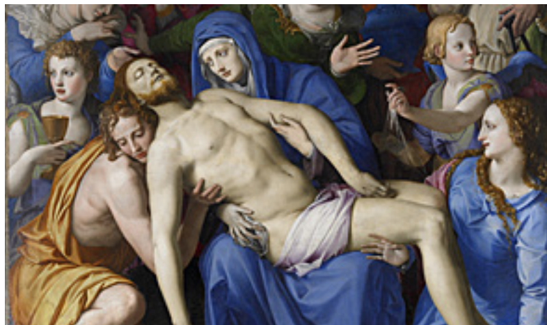
AGNOLO DI COSIMO DIT BRONZINO, La lamentation du Christ mort, Musée des Beaux-Arts, Besançon — France